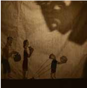
HIGH END MAGAZINE, Jakarta. June 2014

« The group sets up an amazing performance (...) » Galuh Tathya,