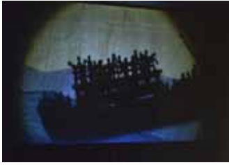
THÉATRORAMA, février 2016

«Créé en 2014 à Jakarta, Frontières est une lente et délicate mélodie qui, au regard des mythes fondateurs et des contes traditionnels, retrace avec finesse, simplicité et lucidité le parcours d'un migrant. Entre tradition et modernité, ce spectacle élégant rend un hommage simple et profond à tous ceux qui sillonnent notre planète, et nous relie délicatement à notre lumière intérieure.»